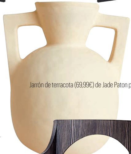
Jarrón de terracota (69,99€) de Jade Paton para Zara Home .