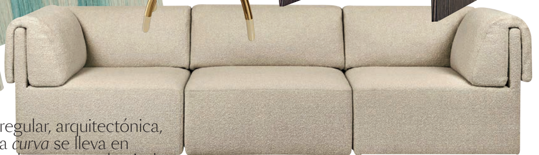
Sofá Wonder de Space Copenhagen para Gubi .