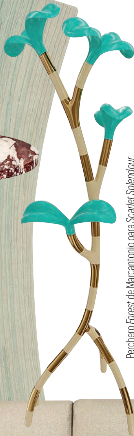
Perchero Forest de Marcantonio para Scarlett Splendour .