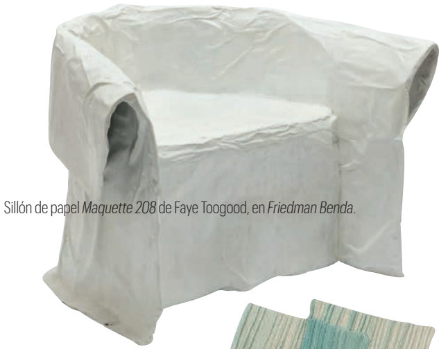
Sillón de papel Maquette 208 de Faye Toogood, en Friedman Benda .