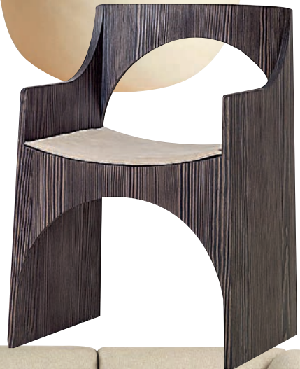
Butaca Cle de Christophe Delcourt para Kooku .